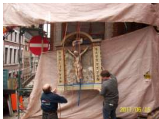
Démontage du crucifix de la façade