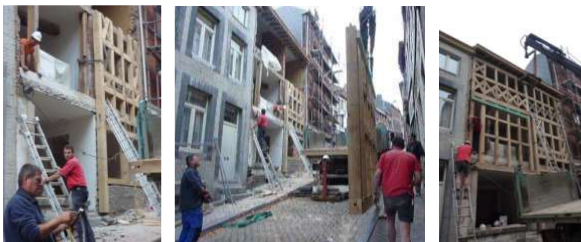
Remontage de la façade le 13 juillet 2011