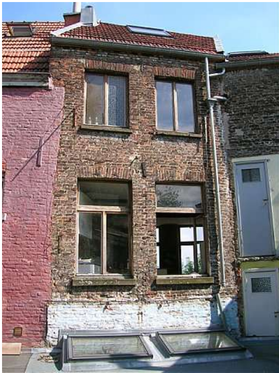
Arrière de la maison, photo prise de la cour. Fenêtres horizontales de la salle de réunion. Fenêtres ouvertes de l'appartement du 1 er .