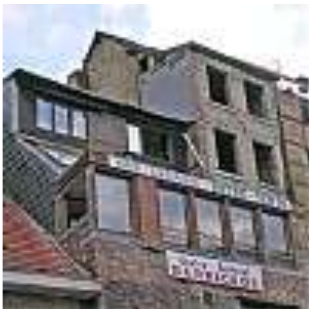
Façade arrière Vue depuis la rue derrière le Palais des Princes-Evêques

Des travaux d'entretien sont évidemment régulièrement nécessaires dans ces maisons.