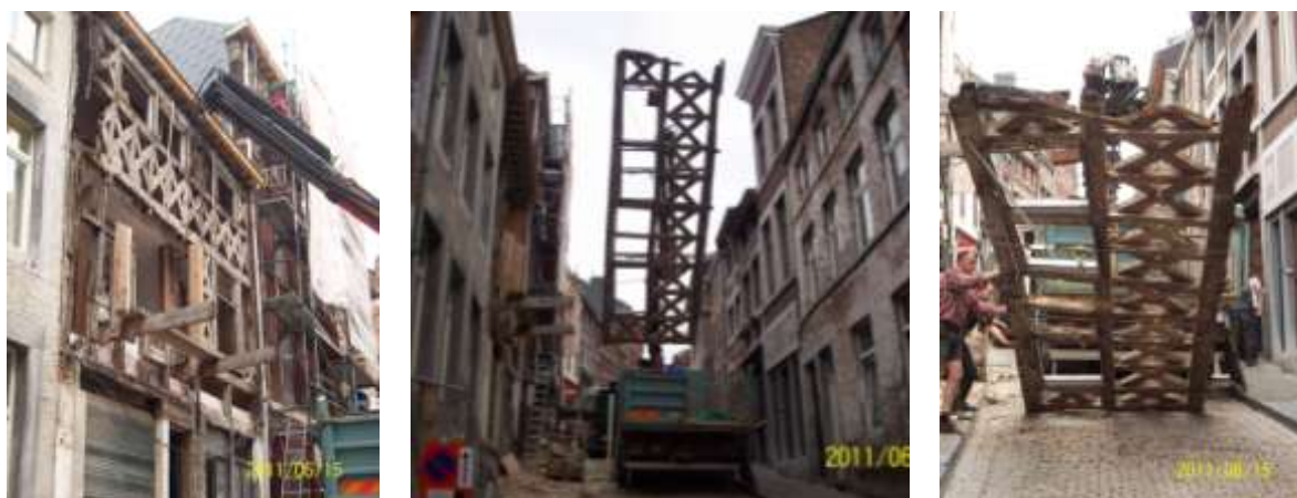
Démontage du colombage le 15 juin 2011

Heureusement, cette hypothèse s'est vérifiée et le colombage a été démonté puis le nouveau a été mis en place le 1er juillet.