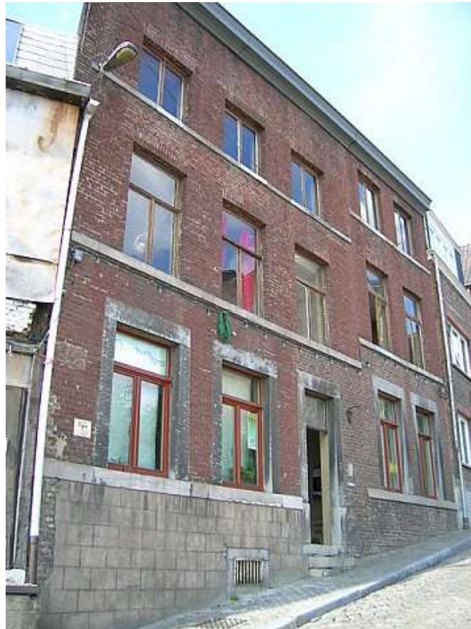
Façade du bâtiment, avec vue sur la gare de Liège Palais.

Dans la foulée de l'achat des bâtiments de Barricade, Les Tournières a acquis une autre maison située dans le même quartier.