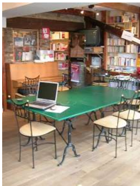
Vue à l'intérieur, salle polyvalente au rez-de- chaussée