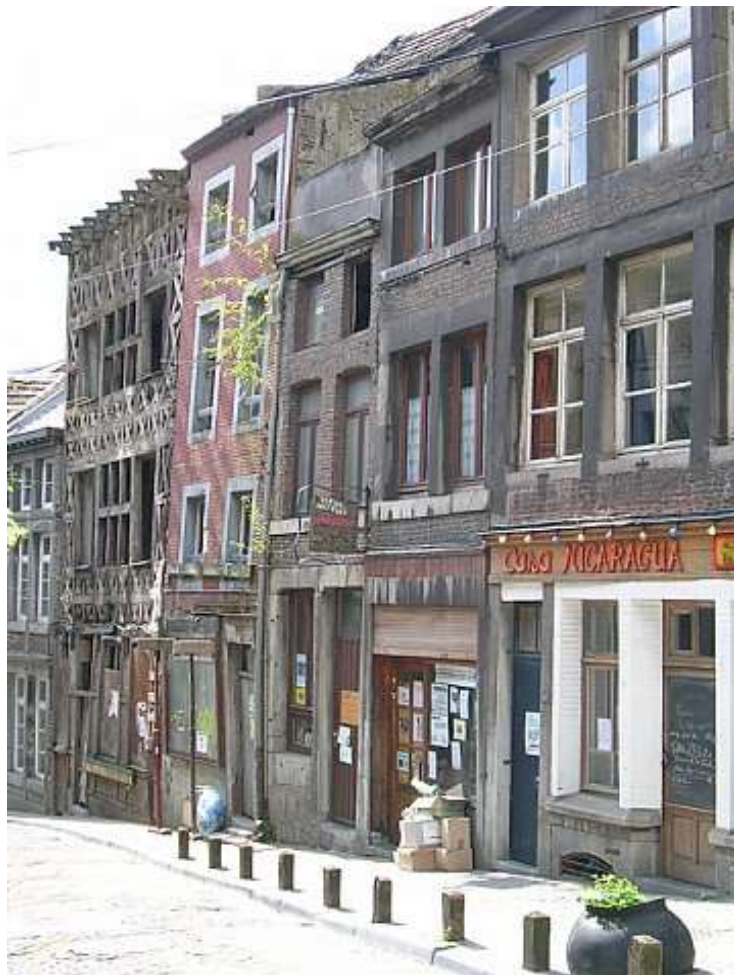
Les deux maisons entre la façade rouge et le Casa Nicaragua.

C'est la menace de mettre le bâtiment utilisé par l'association Barricade en vente publique qui fut l'élément déclencheur de la dynamique des Tournières . Qu'allaient devenir la librairie Entre-Temps, le Groupe d'achat commun de produits biologiques, l'espace de réunions et de vie, et le centre culturel Barricade dans son ensemble ?