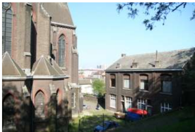
Ancien presbytère avec vue sur l'église

Au n°45 de la même rue que le bâtiment précédent, au fond d'une allée qui contourne l'église, un dernier bâtiment a été acquis par Les Tournières . Le rez-de-chaussée est aménagé pour des bureaux et accueillent des associations.