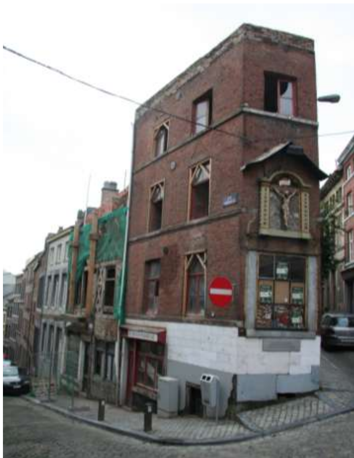
Côté rue Pierreuse

En cours de rénovation. Utilisation prévue : logements de transit et bureaux