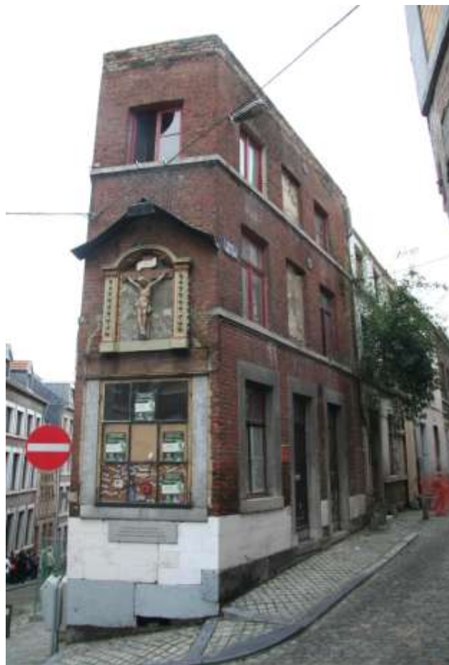
Côté rue Volière

Cet ensemble de maisons a été acquis en 2006. L'objectif est de le transformer en logements de transit qui seront loués en partenariat avec l'asbl Thais.