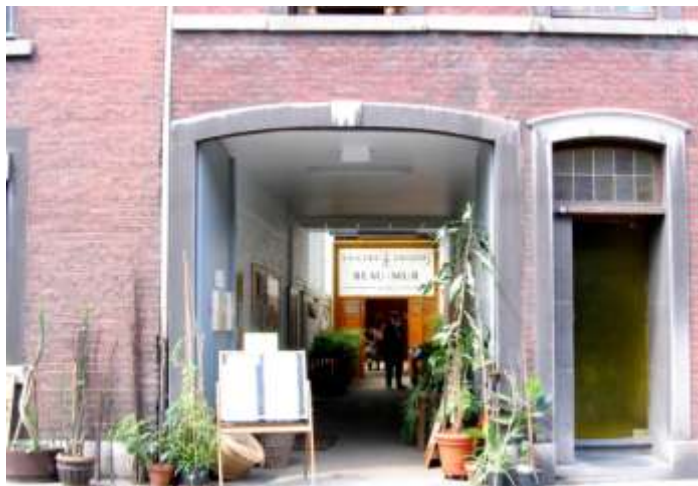
Entrée du centre culturel Beau Mur

Locataires : Centre culturel du Beau Mur et associations liées